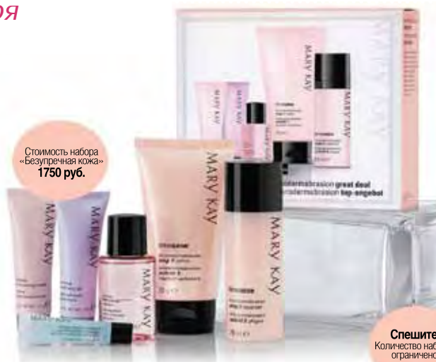
Стоимость набора «Безупречная кожа» 1750 руб.

*количество наборов ограничено. Успевайте заказать!