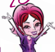
НАДОЛИНСКАЯ Наталья 30 800 руб.