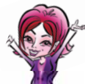
КУЗНЕЦОВА Ирина 26 400 руб.