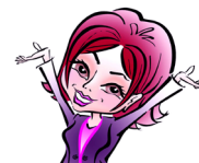
КРЫЛОВА Юлия 20 000 руб.