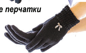
Перчатки классические (2 пары)