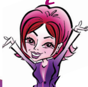
КОСТЮК Светлана 20 000 руб.