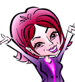
КРЫЛОВА Юлия 32 000 руб.

Если вы думаете, что вы сможете - вы сможете.