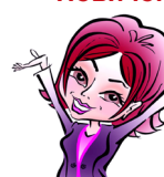
НАДОЛИНСКАЯ Наталья 38 000 руб.