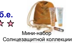
Мини-набор Солнцезащитной коллекции