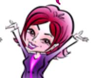
ДАШКОВА Татьяна 12 000 руб.