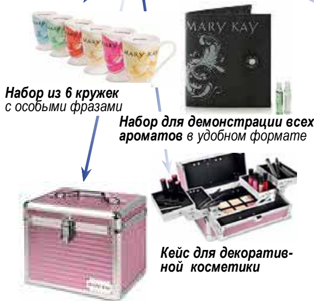
Набор из 6 кружек с особыми фразами