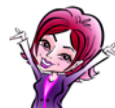
АХМЕТШИНА Галина 14 000 руб.