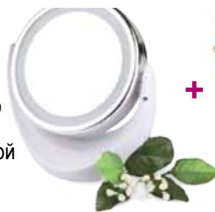
Зеркало с LED-подсветкой