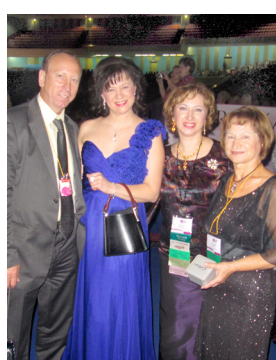
С Национальными Лидерами