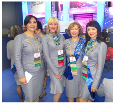
С Лучшими Лидерами