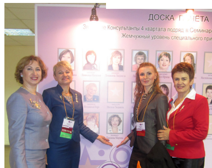
У Доски почета