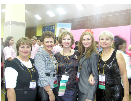
Новые Лидеры в 2010-2011 Семинарском Году! «Сделаем!»