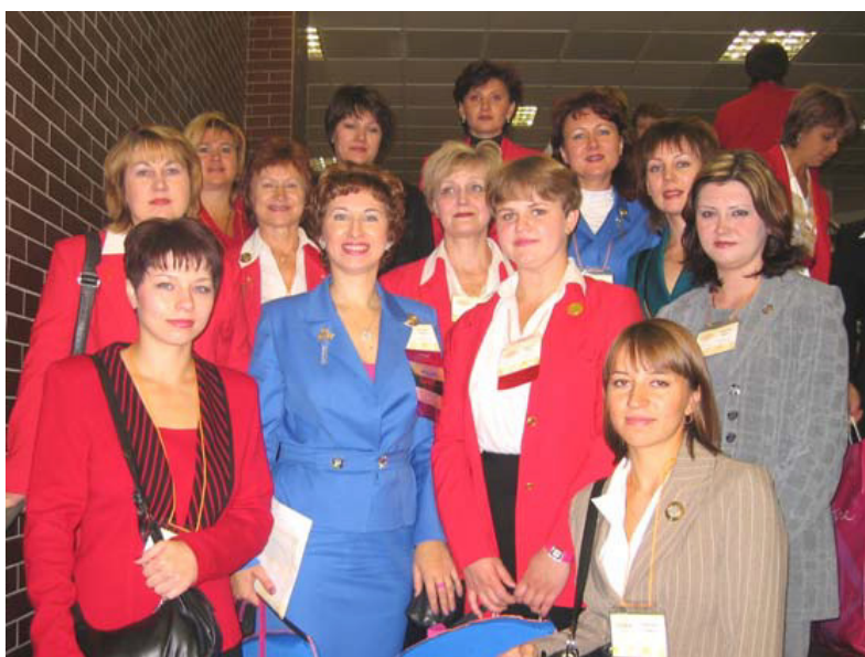
2004 год, Концертный Зал «Олимпийский»