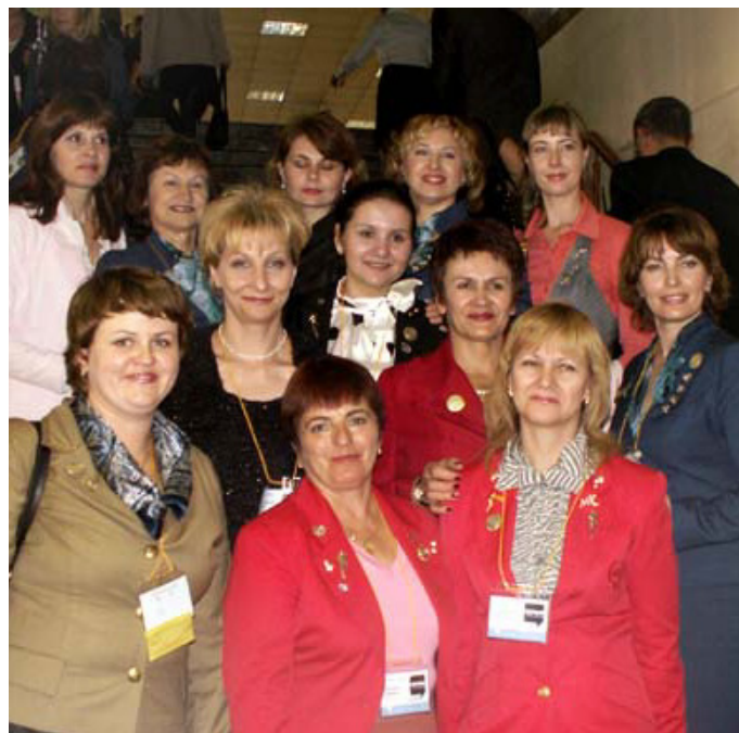
2009 год, Концертный Зал «Олимпийский»