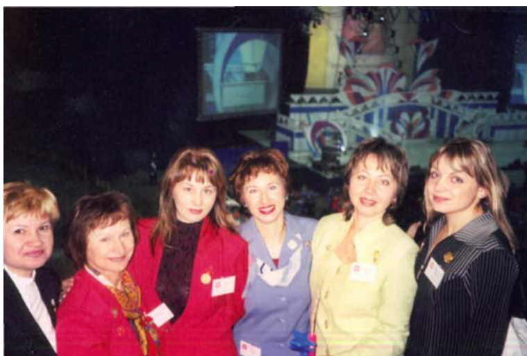
2003 год, Концертный Зал «Олимпийский»