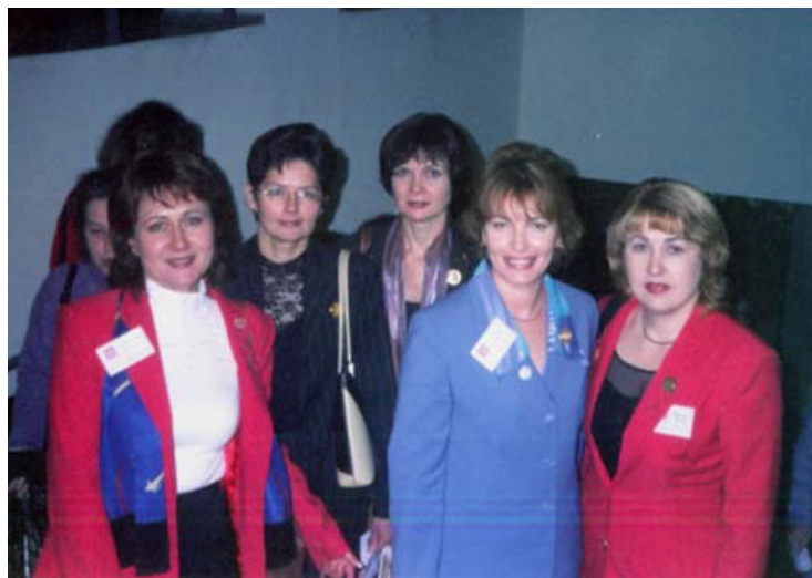
2003 год, Концертный Зал «Олимпийский»