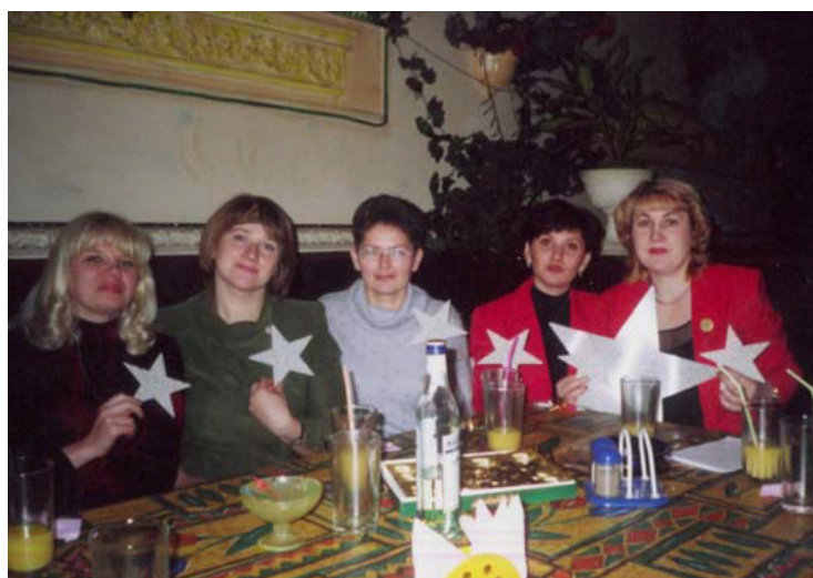
2003 год, Кафе «Власиха»