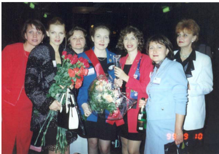
1999 год, Концертный Зал «Россия»