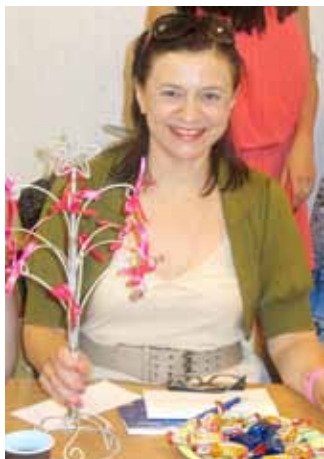
Наш Почетный Гость - NSD Евгения Ерохина сделала нашу Встречу просто Волшебной!